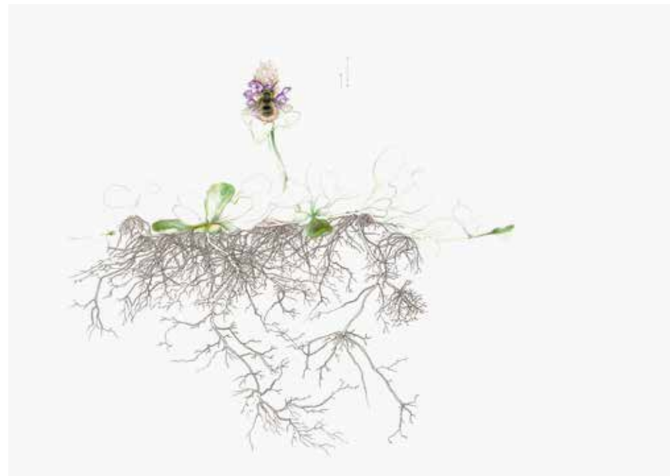
Lise Duclaux An european wool carder bee on a common self heal Anthidium manicatum, Prunella vulgaris 2023 Inchiostro a pigmenti, matite colorate e pittura su carta 32 x 45 cm Courtesy Annie Gentils Gallery © Lise Duclaux / 2024, ProLitteris, Zurich

Contemporary art is a laboratory in which artists experiment with a great diversity of materials to explore the issues of the day. The exhibition «Underground. Exploring Ecosystems» invites us to consider the profusion of our interconnections and interdependencies and to view today's globalised world as an opportunity for creativity and regeneration. Nature, accordingly, becomes a source of inspiration, not only for art but also for the development of new social models.