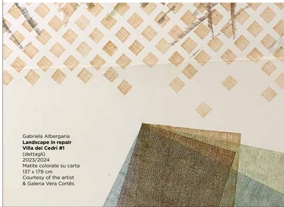
Gabriela Albergaria Landscape in repair Villa dei Cedri #1 (dettagli) 2023/2024 Matite colorate su carta 137 x 179 cm